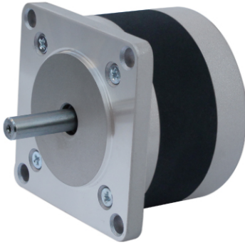
57BH系列步进电机参数列表 NAME 23BH(inch)series step-motor parameter list

NAME 23BH ( inch ) Series two-phase (four-phase ) stepper motor