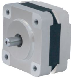
35BHM系列步进电机参数列表 NAME 14BHM(inch)series step-motor parameter list

NAME 14 ( inch ) Series two-phase (four-phase) stepper motor